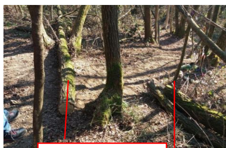
Tratti del tronco d'albero tagliato con la motosega