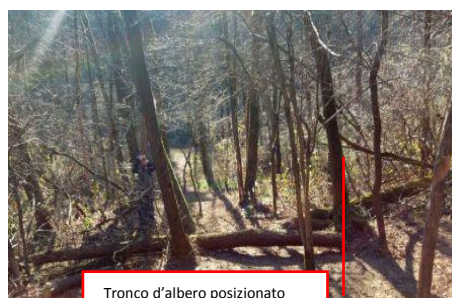
Tronco d'albero posizionato alle spalle del pensionato contro cui è rimasto schiacciato

Tipo di Infortunio: Proiezione di solidi / Colpito da una porzione di tronco durante il taglio