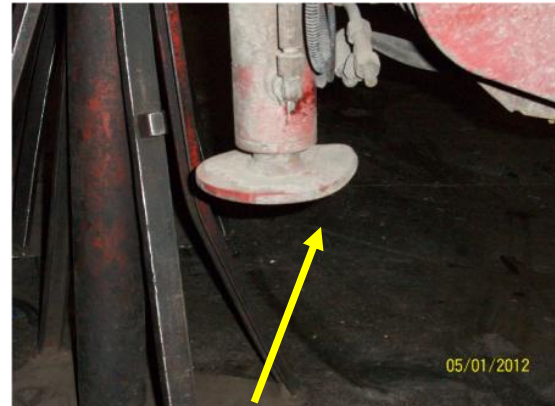
base deformata stabilizzatore idraulico sponda

Tipo di Infortunio: Caduta dall'alto di gravi / Schiacciato sotto un mezzo in riparazione