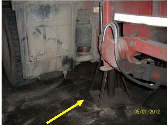
Supporto fisso non presente durante l'infortunio

rif. ATS Db inf. n. °11 / 2012 / Rev.n°6