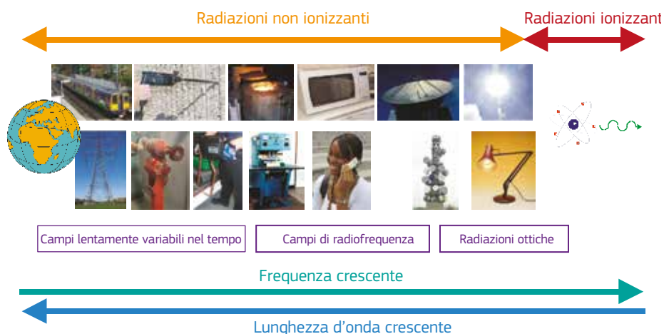
Figura 3.1 — Rappresentazione schematica dello spettro elettromagnetico in cui figurano alcune tipiche sorgenti

La presente guida intende fornire ai datori di lavoro informazioni sulle sorgenti di campi elettromagnetici situate nell'ambiente di lavoro, per aiutarli a decidere se sia necessaria un'ulteriore valutazione dei rischi derivanti dai campi elettromagnetici. Le dimensioni e l'intensità dei campi elettromagnetici prodotti dipende dalla tensione, dalle correnti e dalle frequenze con cui l'apparecchiatura funziona o che essa genera, nonché dalla sua progettazione. Alcune apparecchiature sono progettate in modo da generare intenzionalmente campi elettromagnetici esterni. In tal caso, piccole apparecchiature a bassa potenza possono produrre notevoli campi elettromagnetici esterni. Generalmente le apparecchiature che utilizzano correnti o tensioni elevate o che sono progettate per emettere radiazioni elettromagnetiche richiedono un'ulteriore valutazione.