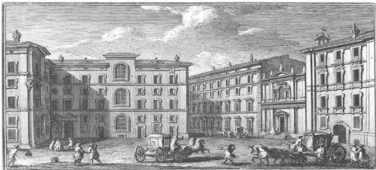
Seminario Romano Caravante, che corrisponde sulla piazza di S. Ignazio, a Chiesa di S. Maria, e Prospetto del Seminario Romano a Part. del Convento del PP. Domenicani