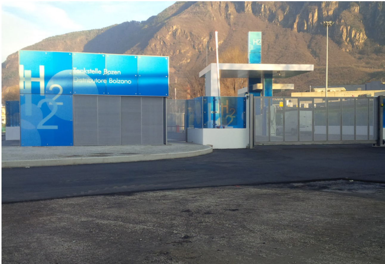
LA STAZIONE DI RIFORNIMENTO DI IDROGENO DI BOLZANO.

Un ulteriore vantaggio delle auto ad idrogeno, rispetto alle auto tradizionali, è la silenziosità: in questo le auto ad idrogeno sono simili alle auto elettriche pure (EV). Le celle a combustibile non producono rumore in quantità rilevante: nel caso della Toyota Mirai, oltre al rumore aerodinamico e dovuto al rotolamento degli pneumatici, l'unico generatore di (poco) rumore è dato dal compressore che immette aria, cioè ossigeno, nelle celle.