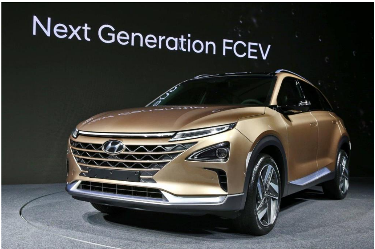
LA NUOVA HYUNDAI FUEL-CELL.

Un ulteriore aspetto, esterno ai veicoli ma ad essi collegato, riguarda il trasporto dell'idrogeno. Una eventuale futura diffusione dei veicoli ad idrogeno comporterà la necessità di realizzare una serie di infrastrutture di rifornimento, per le quali è in corso di preparazione una normativa da parte dei Vigili del Fuoco. Inoltre, se continuerà a non essere economicamente conveniente la produzione di idrogeno mediante elettrolisi dell'acqua, che è disponibile più o meno ovunque ed in ogni caso è facilmente trasportabile in tutta sicurezza, bisognerà prevedere una serie di veicoli per il trasporto dell'idrogeno su gomma o su ferro. Un carico di bombole di idrogeno che se ne va in giro sulle strade o sulle linee ferroviarie è uno di quegli incubi che faranno dormire sonni poco tranquilli ai Comandanti dei Vigili del Fuoco.