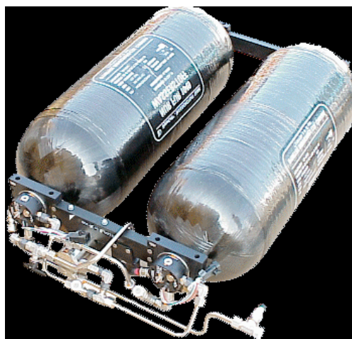
BOMBOLE DI IDROGENO COMPRESSO A 700 BAR PER AUTO FCEV.

Naturalmente è troppo presto per una valutazione del rischio di incendio o di esplosione basata scientificamente su serie stabili di dati statistici, ma sorge il dubbio che la verità stia nel mezzo. Nell'impossibilità di procedere ad una valutazione quantitativa del rischio, ciò che è possibile fare oggi è soltanto procedere ad una lista di possibili pericoli, senza che sia possibile associarvi una probabilità.