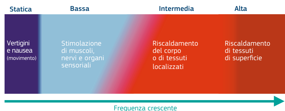
Figura 2.1 — Effetto dei campi elettromagnetici con diverse gamme di frequenza (gli intervalli di frequenza non sono in scala)

Questi concetti sono illustrati nella figura 2.1.